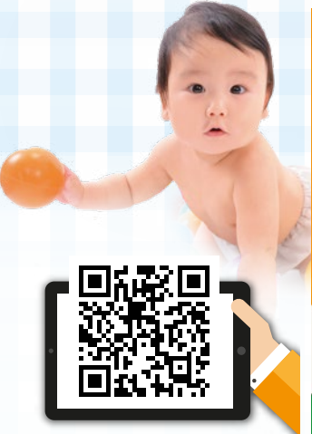
兒童疫苗計劃詳情